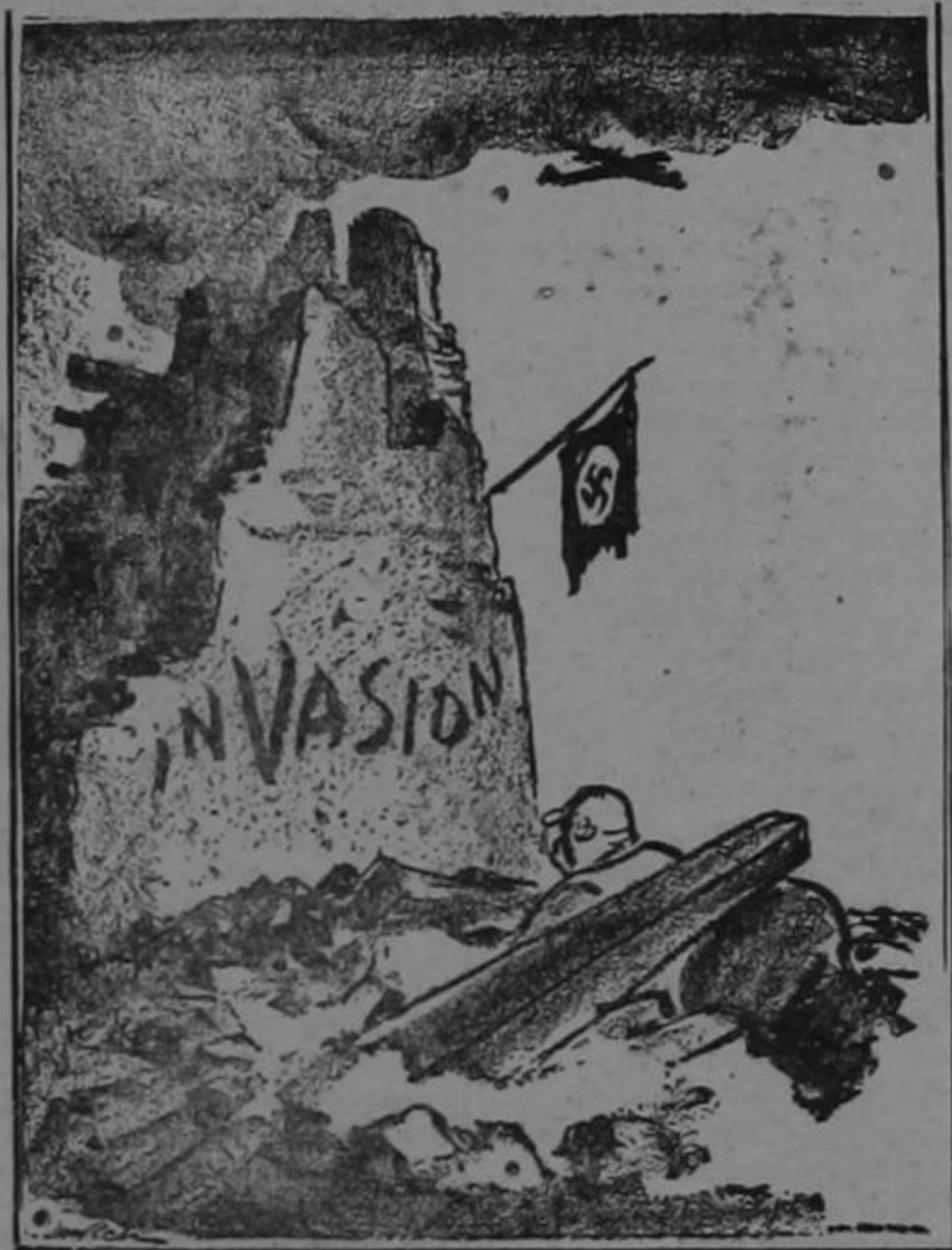
PRESAGIO DEL PORVENIR

Pídalo en todos los establecimientos - Cada barra dice "Fortuna" con todas sus letras