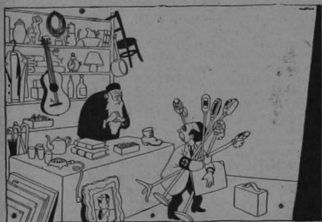
Goebbels: "Cuanto me ofrece Ud. por el lote...?"