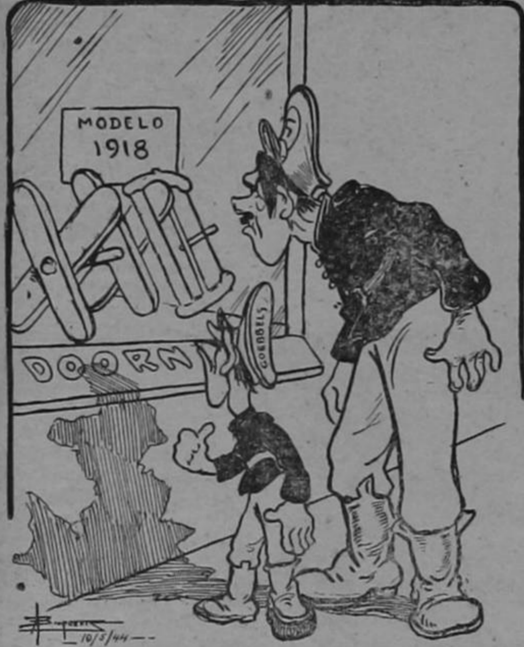
Goebbels: "Por lo menos podíamos enterarnos del precio, no te parece...?"

podrá decir que la rata es un manjar sabroso. Tiene un gusto delicioso, da fuerza a los empleados; y ustedes, con dos bocados, en dos horas, si son vivos, podrán hacer mil recibos con la zurda y acostados...! La rata bien se cotiza y matarla es muy sencillo: con decir un chascarrillo ella se muere de risa. Dicen que así no agoniza cual sucede en ratonera; además de esta manera, se le cobra más al cliente, pues una rata sonriente no es una rata cualquiera. Podrían hacerse mil listas de esta clase de roedores: ratas de ojos soñadores, ratas tontas, ratas listas, ratas serias o bromistas; ratas solteras, casadas, ratas viudas, divorciadas, acompañando retratos; y hasta ratas patronatos que son las más codiciadas. Las ganancias entre todos se reparten a pro...rata; y pronto veremos plata si es que no somos beodos. Este es uno de los modos