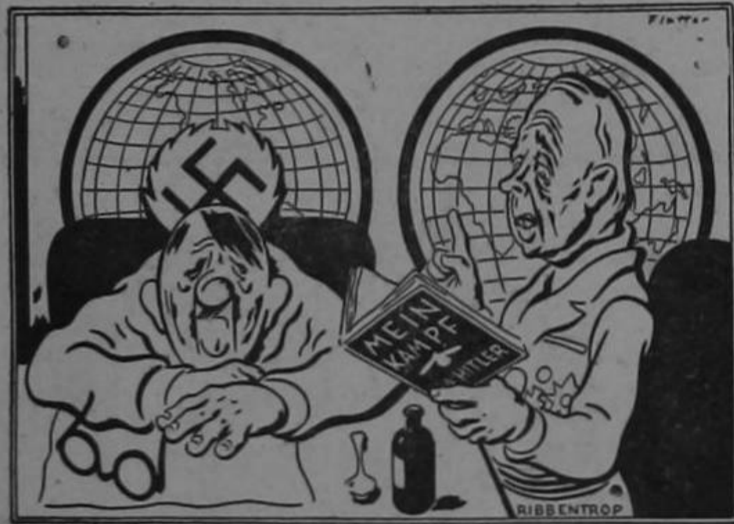
"Por favor, Joachim, léeme otra vez ese pasaje mío en el 'Mein Kampf'!" uno de los picadistas más entusiastas